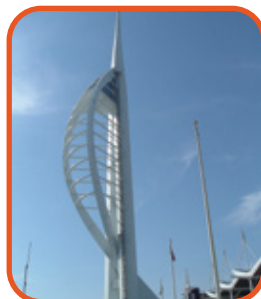
Portsmouth - Spinnaker Tower