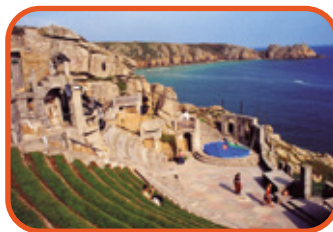
Cornwall - Minack Theatre