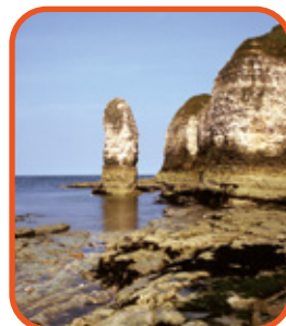
Sev. Anglie - Flamborough Head