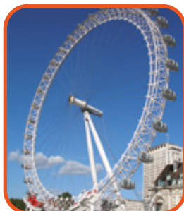
Londýn - London Eye