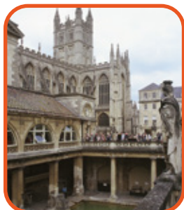
Bath - Římské lázně