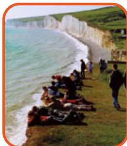
Eastbourne - křídové útesy