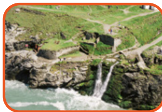
Cornwall - Tintagel