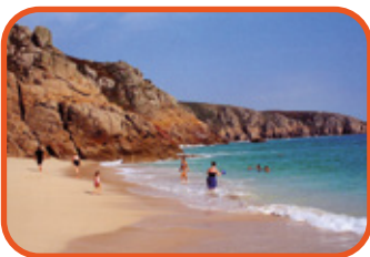
Cornwall - pláž u Porthcurno